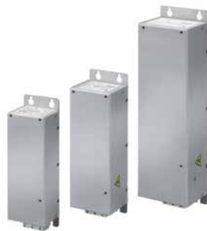
Размери на корпуса Три различни размера на корпуса на линейните филтри съответстват на M1, M2 и M3 корпуси на VLT® Micro Drive